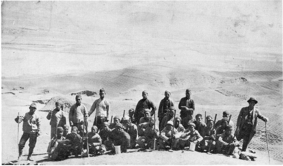
昭和16年4月 斗金山造林地 右端著者